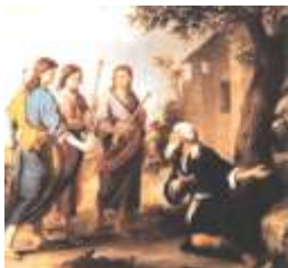
Encina de Mambré